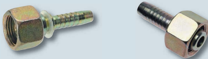
Typ DKL 1-/ 2-lagig