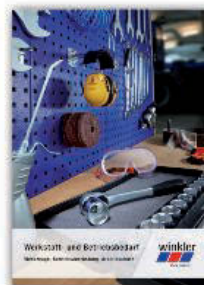
Werkzeuge, Betriebsausrüstung, Arbeitsschutz