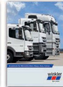
Ersatzteile für Mercedes-Benz Atego, Axor, Actros