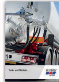
Tank- und Siloteile