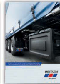
Fahrzeugbauteile und Ladungssicherung