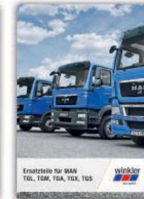
Ersatzteile für MAN TGL, TGM, TGA, TGX, TGS