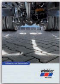
Fahrwerks- und Bremsenteile