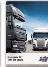
Ersatzteile für DAF und Scania