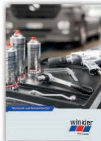
Werkstatt- und Betriebsbedarf