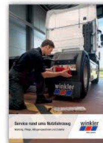
Service rund ums Nutzfahrzeug