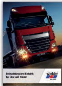
Beleuchtung und Elektrik für Lkw und Trailer