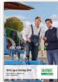
Landwirtschaftliche Ersatz- und Verschleissteile