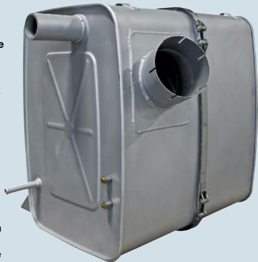
Dieselpartikelfilter für Lkw mindern den Rußpartikelaußstoß um nahezu 100%.

Nähere Informationen rund um das Thema Dieselpartikelfilter erhalten Sie selbstverständlich bei Ihrem winkler Fachberater oder direkt in einem winkler Betrieb.